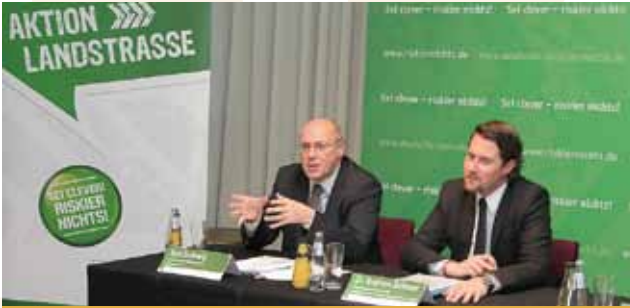
DVW-Präsident Kurt Bodewig (links) und der Parlamentarische Staatssekretär Dr. Andreas Scheuer stellten die Aktion vor.

Rund 60 Prozent aller Verkehrstoten in Deutschland sind auf Landstraßenunfälle zurückzuführen. Besonders häufig betroffen sind Pkw-Fahrer bis 25 Jahre. Mit der „Aktion Landstraße“ will die Deutsche Verkehrswacht (DVW) junge Fahranfänger zum Nachdenken anregen und zum Mitmachen motivieren. Im Mittelpunkt der Kampagne steht ein Musikwettbewerb.