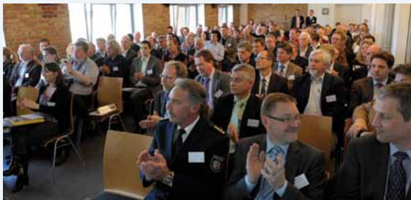
Einem informativen ersten Tag im Plenum ...