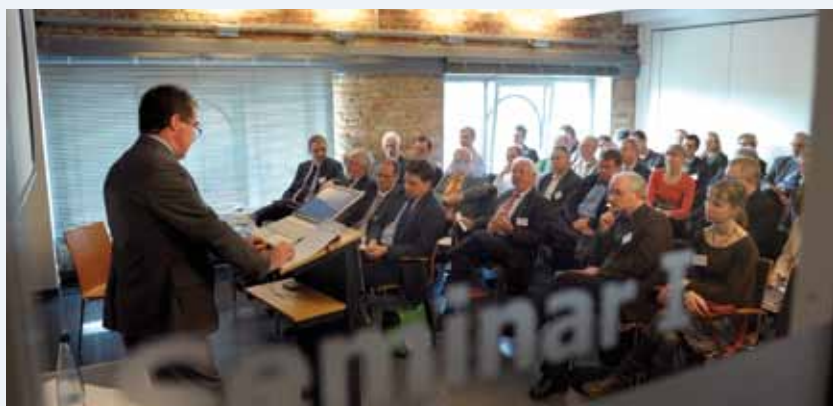
... folgte ein arbeitsreicher Tag in den drei Foren.