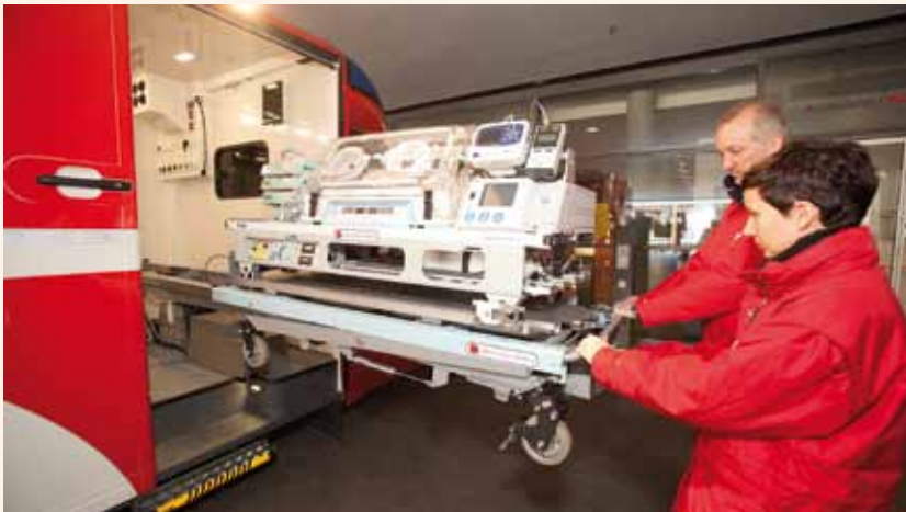
Im transportablen Inkubator werden die Frühgeborenen wie auf Händen getragen.

Mehr als 30.000 Frühgeborene pro Jahr müssen von einer Geburtsklinik in eine Spezialklinik befördert werden. Die Belastungen einer solchen Verlegungsfahrt durch Erschütterungen und Lärm sind für Frühchen enorm und können ihre Gesundheit schädigen. Darüber hinaus benötigen sie während der Fahrt eine kontinuierliche intensivmedizinische Betreuung. Erfordernisse, die herkömmliche Notarztwagen in vielen Fällen nicht oder nur unzureichend erfüllen, weil sie auf den Transport von erwachsenen Patienten ausgerichtet sind.