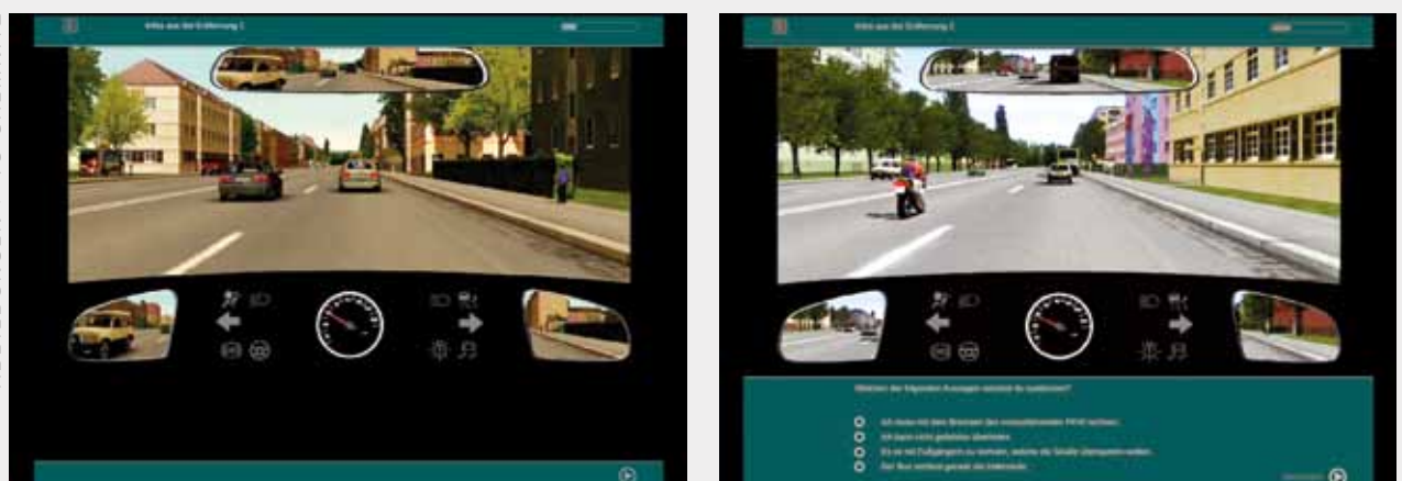
Computergestütztes Lernangebot unterstützt das vorausschauende Erkennen von Gefahren.