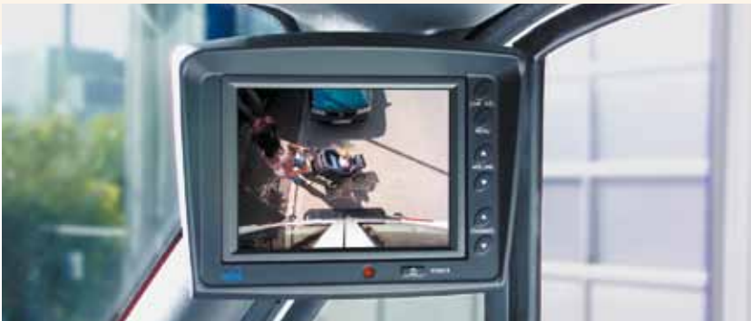
Mit dem Rückfahrassistenten sind Frau und Kinderwagen im kritischen Bereich hinter dem Fahrzeug zu sehen.

Die Darstellung der gesamten Untersuchung ist nachzulesen unter www.udv.de/fahrzeugsicherheit/lkw/fahrerassistenzsysteme .