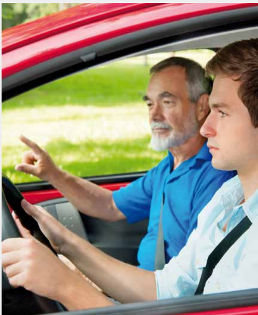
Erfahrener Begleiter auf dem Beifahrersitz.