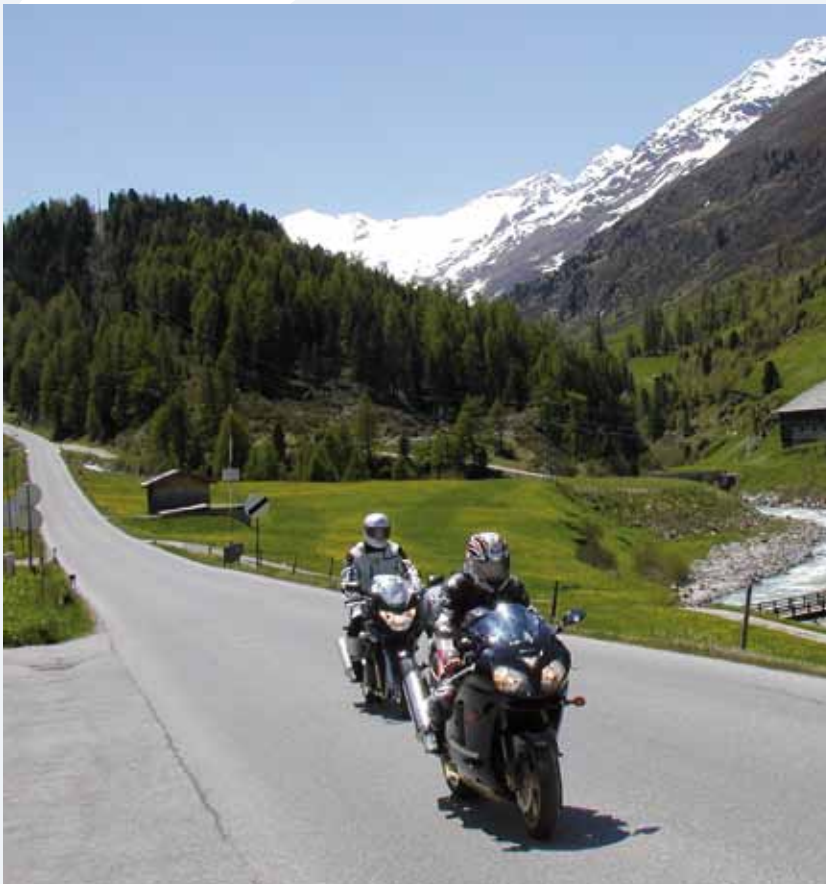
Gut vorbereitet kann der Urlaubstrip beginnen.

Urlaub mit dem Motorrad erfordert Vorbereitung