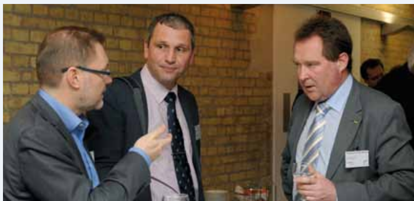
Meinungsaustausch in den Pausen