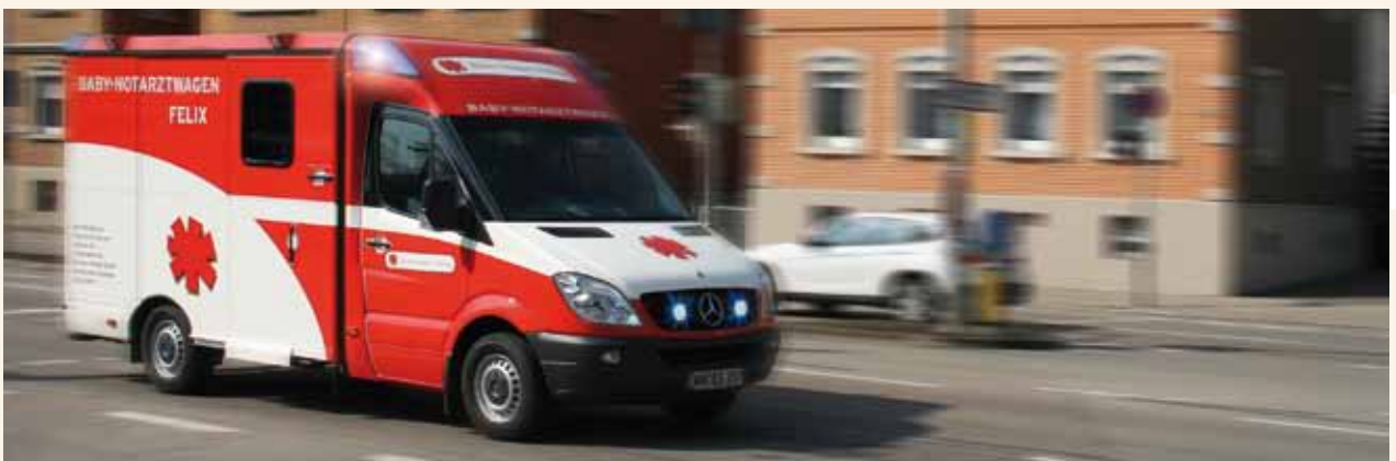
„Felix“ soll in fünf Jahren bundesweit im Einsatz sein.

Spezielle Schulungs- und Simulationstrainings für das Fahr- und Klinikpersonal stellen eine optimale lebensrettende Rundumbetreuung sicher und bilden gemeinsam mit den Fahrzeugen das weltweit erste ganzheitliche Baby-Notarztwagen-System. Insgesamt plant die Björn Steiger Stiftung, innerhalb der kommenden fünf Jahre bundesweit 60 „Felix“-Fahrzeuge zur Verfügung zu stellen.