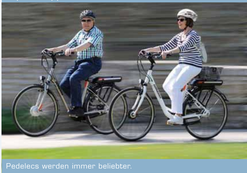
Pedelecs werden immer beliebter.

Expertentipps rund ums Radfahren mit Elektromotor