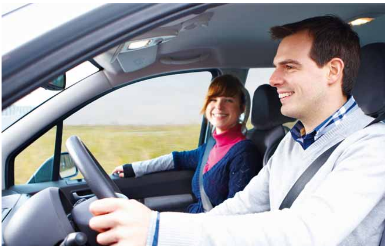
Der Gurt, Lebensretter Nummer eins, wird leider noch nicht von allen Verkehrsteilnehmern genutzt.