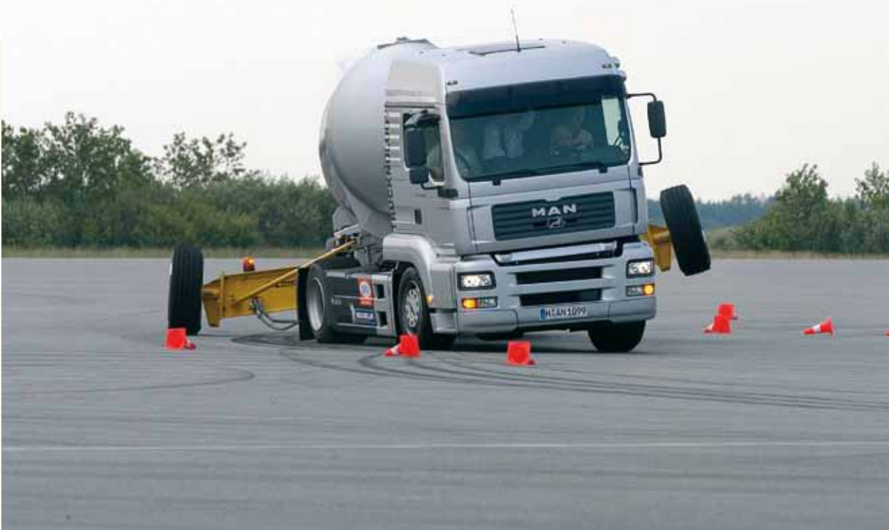
Greift ein, wenn der Lkw zu schleudern oder zu kippen droht: ESP